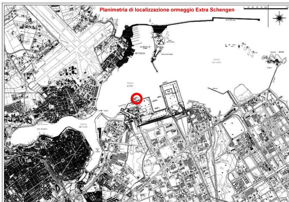
Immagine 2 – Planimetria ormeggio con pontone galleggiante